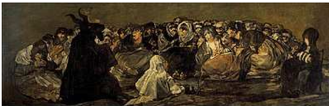
Francisco de Goya, Aquelarre , c. 1823