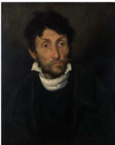
Théodore Géricault, El cleptòman o El boig assassí , 1822-23

Relaciona les obres El cleptòman (1822-23) de Théodore Géricault i Aquelarre (c. 1823) de Francisco de Goya.