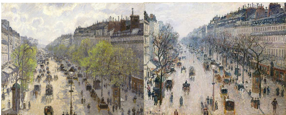
C. Pissarro, El boulevard de Montmartre, primavera - El boulevard de Montmartre, hivern , 1897

Relaciona els orígens de la fotografia amb la pintura impressionista a partir d'aquests dos quadres de C. Pissarro.