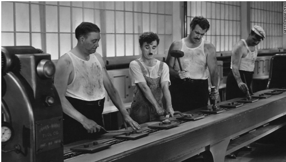
Modern Times , 1936

Compara aquestes dues obres: fotograma de Modern Times , 1936, de Charles Chaplin, i Migrant Mother , 1936, de Dorothea Lange.