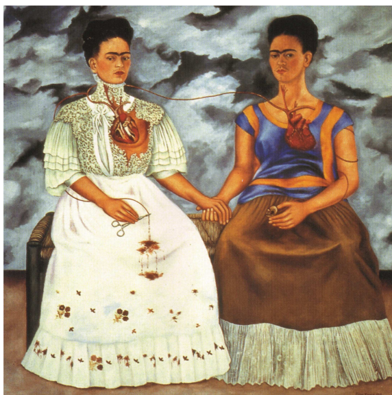
Frida Kahlo, Las dos Fridas , 1939