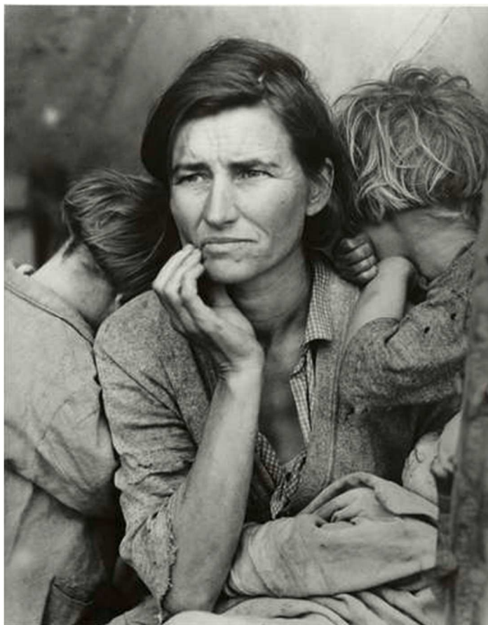
Migrant Mother , 1936