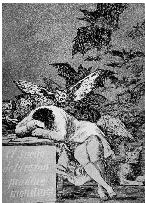
Francisco de Goya, Capricho 43. El sueño de la razón produce monstruos , 1797-1799